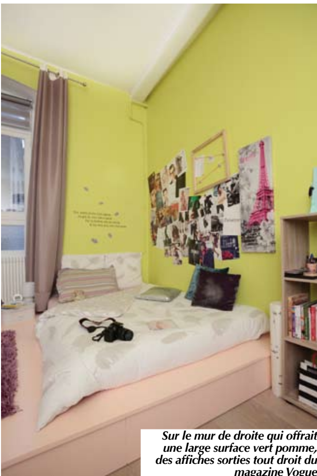
Sur le mur de droite qui offre une large surface vert pomme, des affiches sorties tout droit du magazine Vogue