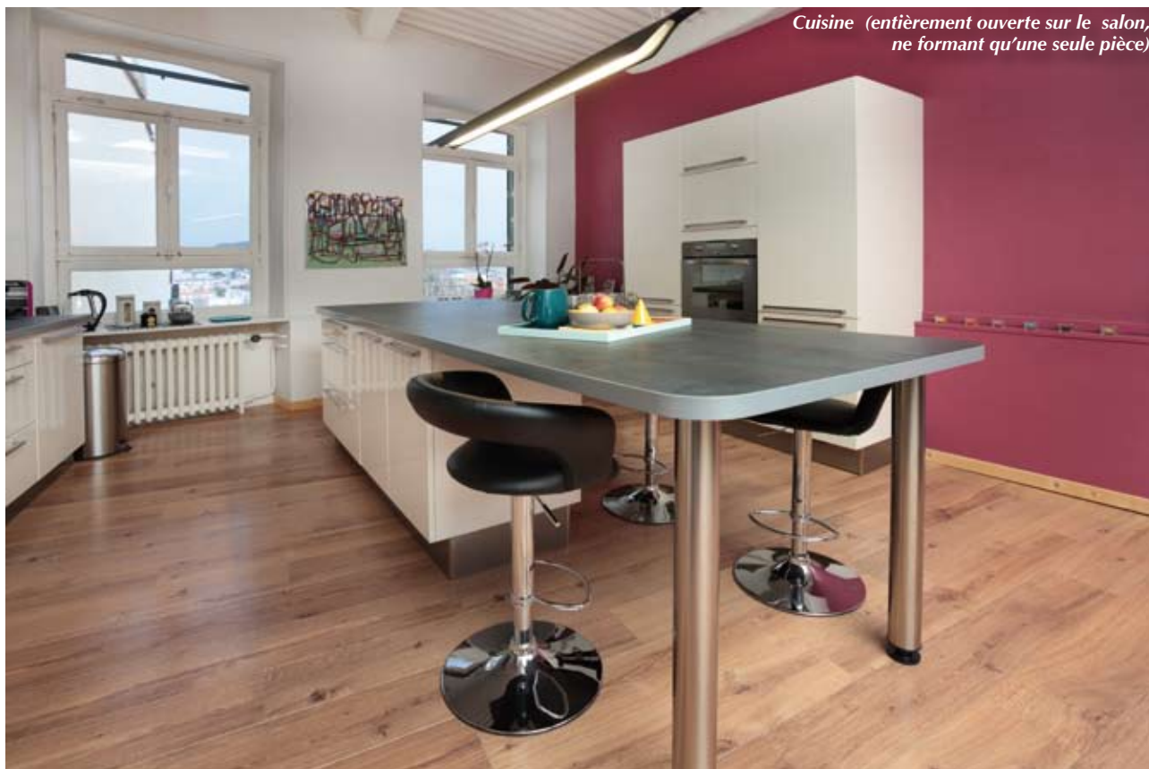
Cuisine (entièrement ouverte sur le salon, ne formant qu'une seule pièce)